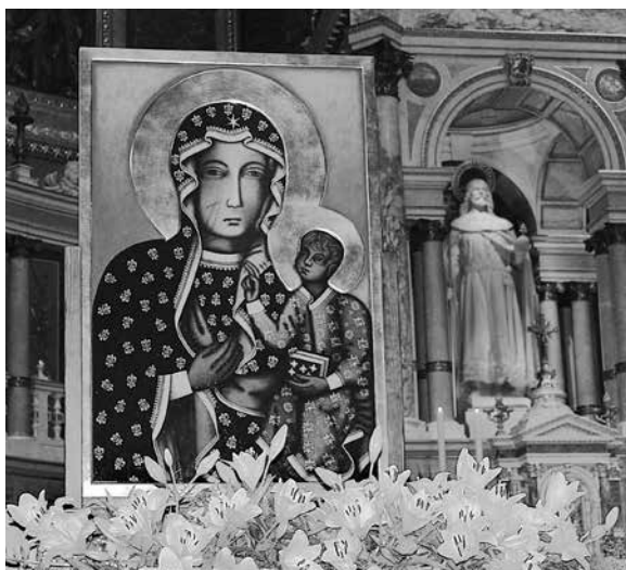
Matka Boska Cz stochowska w Bazylice w. Stefana w Budapeszcie