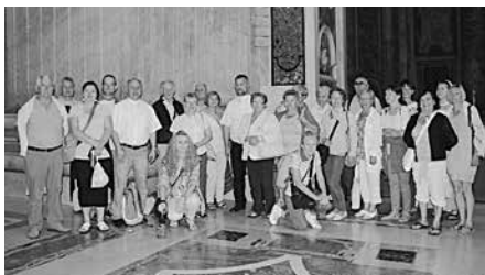
Fot.: Barbara Pál